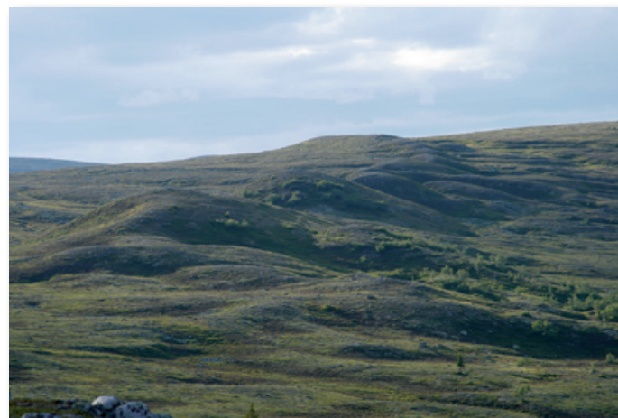
De här ”högarna” kan passa som mål om du har små barn som vill göra topptur. Se tur 15. Nipfjället skymtar i bakgrunden i bildens vänsterkant.

Uppe på fjällheden passerar du snart en stig som leder ned till Svensfoskdal. Du ser också, strax ovanför där skogen letar sig högt upp på sluttningen, en formation av ganska stora ”höggar” som ligger på fjället. Det liknar kanske gravhögar men de är kvarlämnade av inlandsisen.