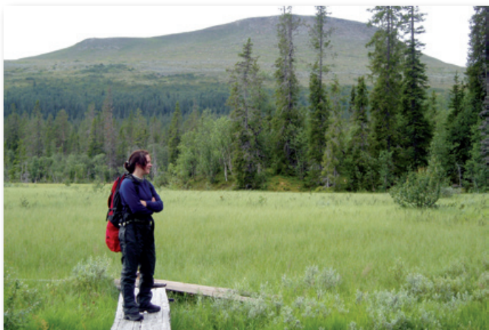
Städjan sedd från Rybäckskojan. Förr slogs den här typen av myrmark och höet bärgades åt djuren.

är finns det en bro som leder över dit. Du passerar en liten bro, (som inte är utmärkt på kartan), över Foskan tidigare längs leden också, ta inte fel på den.